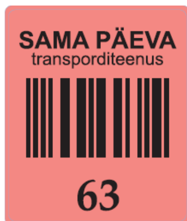
Joonis 6 Lisakleebis „Sama päev“

Eriteip „Ekspress“ DPD Same Day paki markeerimisel mitte kasutada.